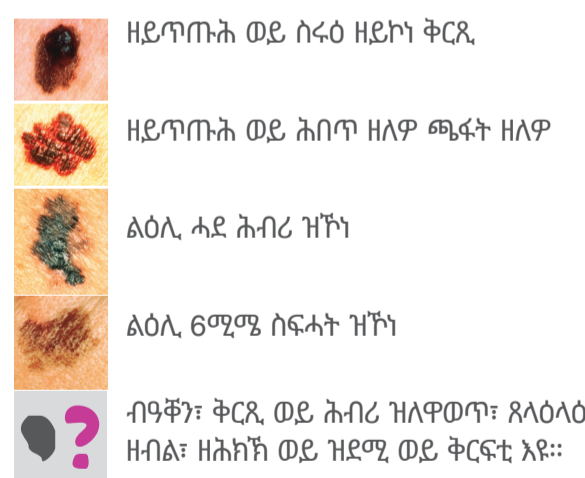
ዘይጥጡሕ ወይ ስሩዕ ዘይኮነ ቅርጺ ዘይጥጡሕ ወይ ሕበጥ ዘለዎ ጫፍት ዘለዎ ልዕሊ ሓደ ሕብሪ ዝኾነ ልዕሊ 6ሚሜ ስፍሓት ዝኾነ ብዓቕን፣ ቅርጺ ወይ ሕብሪ ዝለዎዎ፣ ጸላዕላዕ ዘብል፣ ዘሕክኽ ወይ ዝደሚ ወይ ቅርፍቲ እዩ።